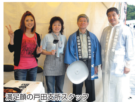
満足顔の戸田支所スタッフ

まず人出に圧倒されました。一日三万人の来場者を見込んだところ約八万人が来場し、出店者すらB級グルメを食べることができませんでした。また途中で電子レンジが壊れ、