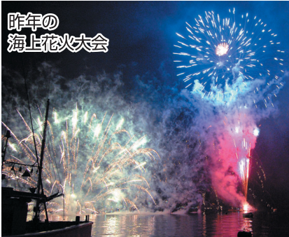
昨年の海上花火大会